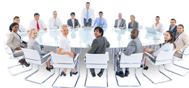
Grupo de Trabajo de Unidad de Mercado