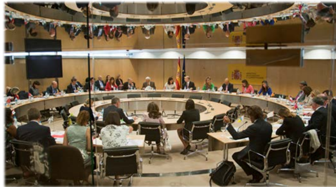
Conferencia Sectorial de Industria y PYME